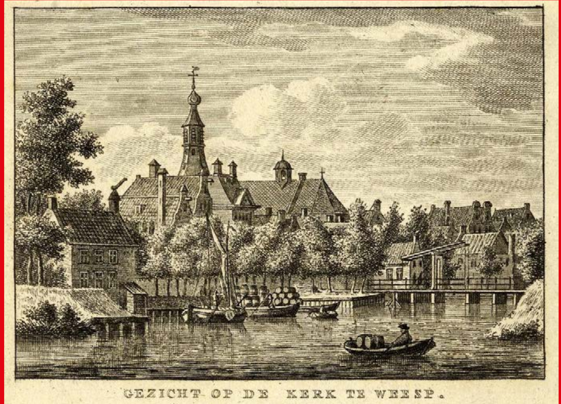
GEZICHT OP DE KERK TE WEESP.