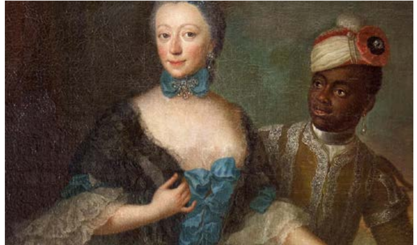
Gravin van Gronsveld (1754) met bediende.

Burgemeesters van Weesp en Weesperkarspel in de 19e eeuw, H.J. Over de Linden Weesper molens, G. S. Koeman-Poel Hoe heette Christiaan?, A. Van der Vegt.